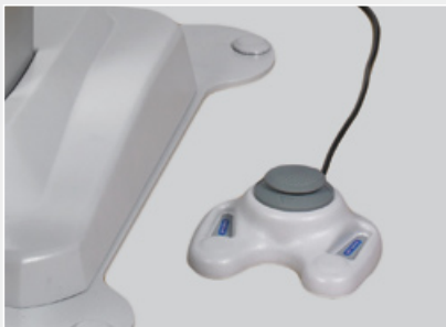
Pedal de control